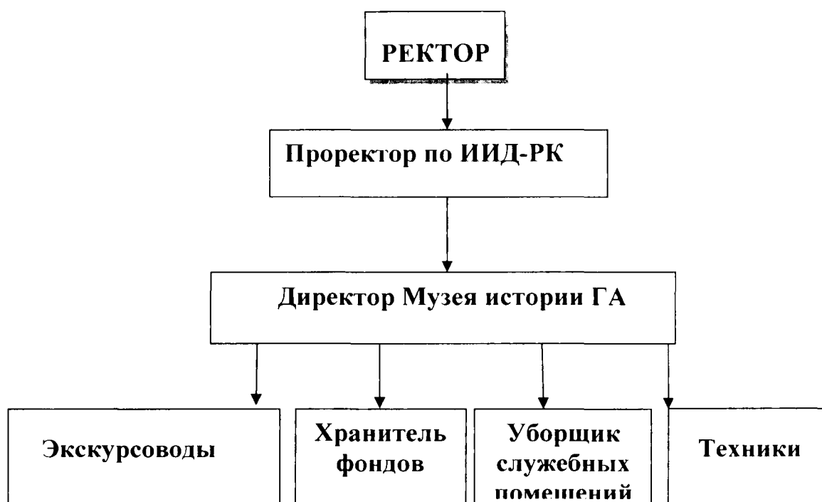
Схема организационной структуры Головного отраслевого Музея истории ГА