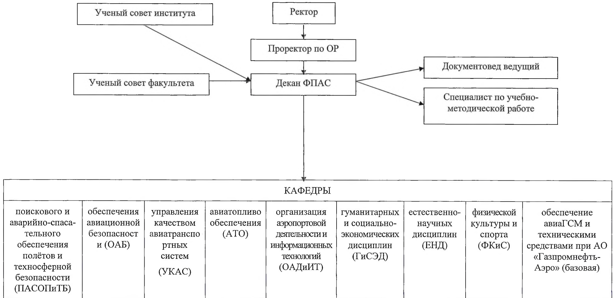
СХЕМА ОРГАНИЗАЦИОННОЙ СТРУКТУРЫ ФАКУЛЬТЕТА ПОДГОТОВКИ АВИАЦИОННЫХ СПЕЦИАЛИСТОВ